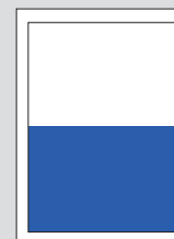
1/2 Seite quer 4 Spalten/120 mm

Bsp. 1 (halbe Seite): 4 Spalten breit und 144 mm hoch in einer Grossauflage: 4 \times 144 \times 3.41 = CHF 1964.16 (exkl. MwSt.)