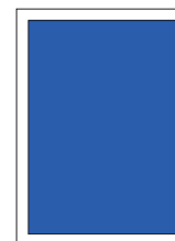
1/1 Seite 7 Spalten/288 mm

Bsp. 1 (ganze Seite): 7 Spalten breit und 288 mm hoch in einer Grossauflage: 7 \times 288 \times 1.34 = CHF 2701.45 (exkl. MwSt.)