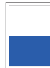
1/2 Seite quer 7 Spalten/144 mm

Bsp. 1 (ganze Seite): 7 Spalten breit und 288 mm hoch in einer Grossauflage: 7 \times 288 \times 1.34 = CHF 2701.45 (exkl. MwSt.)